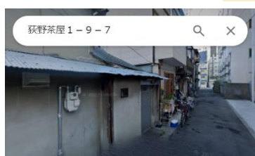
〒557-0004 大阪府大阪市西成区萩之茶屋1丁目9-7